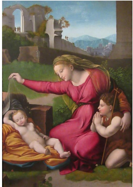
Rafael Sanzio: Johannes als Kind (rechts) mit Maria und dem Jesuskind, um 1510, in der Sakristei der Kathedrale in Toledo

Auszug aus dem Directorium Spirituale Juni 2019